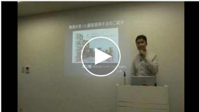
動画を使った顧客獲得手法のご紹介