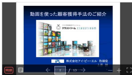
動画を使った顧客獲得手法のご紹介

画面入れ替え 画面入れ替えをクリックすると、下図のように動画画面と資料画面が入れ替わります。 資料を中心に動画を視聴したいときに便利な機能です。